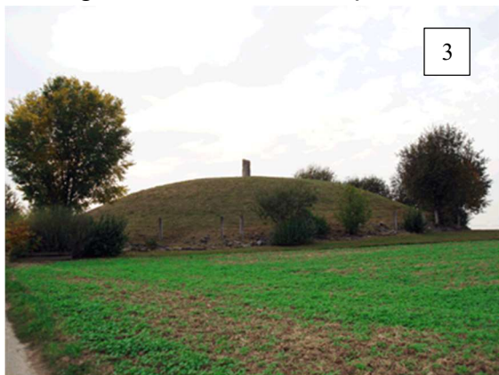
>>> Afbeelding 3 Begraafplaats in een paalkransheuvel

Tijdens deze periode komt er een wijziging in de begravingsmethoden. Men gaat over tot lijkverbranding. De as wordt in een paalkransheuvel bijgezet. Verder is er weinig verandering in de levensgewoonten in de Kempen.