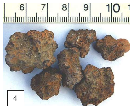
Afbeelding 4 Oerijzererts >>>

Tijdens deze periode gebeurt de geleidelijke infiltratie van de Kelten, afkomstig uit Zuid-Duitsland en Tsjechoslowakije. Zij kenden het gebruik van ijzer en waren dus superieur aan volkeren die alleen maar brons kenden. De Antwerpse Kempen kende tijdens deze periode een dichte bevolking. Sporen van nederzettingen en begraafplaatsen zijn zowat in heel onze omgeving gevonden (Zandhoven, Zoersel, Halle, Grobbendonk, Vorselaar, ...)