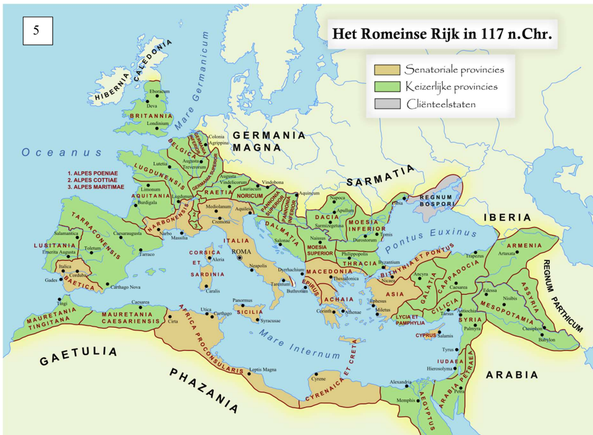
Afbeelding 5 Kaart van het Romeinse Rijk

Opgrovingen te Oelegem, Wijnegem, Halle en Ekeren brengen hiervoor talloze bewijzen aan. De Voorkempen werd doorkruist door de Romeinse heirbaan Bavai – Utrecht, waarlangs Gallo-Romeinse nederzettingen werden ingeplant. De geleidelijke instorting van het Romeinse rijk vanaf 200 na Christus en door de invasies van Germaanse stammen maken rond 300 na Christus een definitief einde aan de Romeinse cultuur.