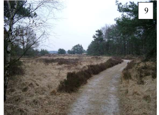
Afbeelding 9 Typisch Kempisch Landschap

Onder Napoleon werd, evenals in de 18 de eeuw, de ontginning van de Kempische heidegronden verder bevorderd en de wegenstructuur uitgebreid. Zo werd de steenweg Antwerpen-Brasschaat doorgetrokken tot Wuustwezel en Breda en de steenweg Antwerpen-Schilde tot Turnhout en Eindhoven.