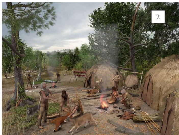
Afbeelding 2 Het leven in het stenen tijdperk

De periode tussen 10 000 en 3 000 voor Christus heet het "Neolithicum". In het neolithicum kenden onze streken een warm en vochtig klimaat, het atlanticum.. Het was gekenmerkt door veel loofbomen (Linde) en de landbouw was reeds duidelijk aanwezig. Kleine nederzettingen vestigden zich in het natte, verruigde en moerassige gebied langs de oevers van de Schelde en de Schijn.