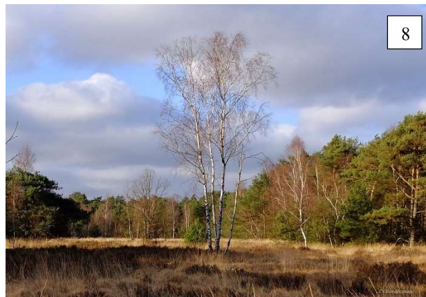
Afbeelding 8 Heidelandschap in De Kempen

Tijdens de Spaanse Successieoorlog hebben voornamelijk de gemeenten Brasschaat, Schilde en Halle zwaar geleden onder de militaire invallen. Zo werd in 1702 in opdracht van Lodewijk XIV een verdedigingslijn aangelegd aan de zuidgrens van Schilde langs de Schijn. In het uiterste noorden van de gemeente sloegen in 1703 de Fransen hun kamp op. Op 30 juni 1706 vond in Brasschaat een bloedig treffen plaats tussen de Fransen en geallieerden onder de Hertog van Marlborough. De gemeente Halle werd in 1705-1706 verwoest. Te Schilde-Brecht vond op 14 juni 1746 de zogenaamde “Convooislag” plaats tussen Fransen en Oostenrijkers.